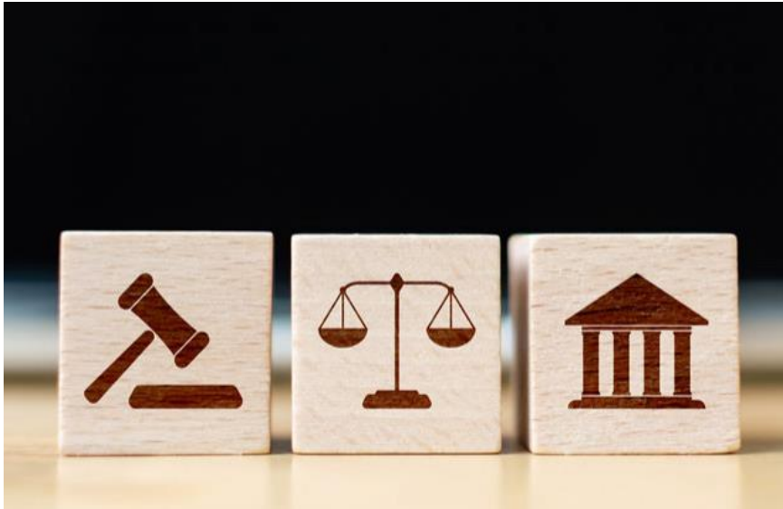
Reforma Laboral en ciernes