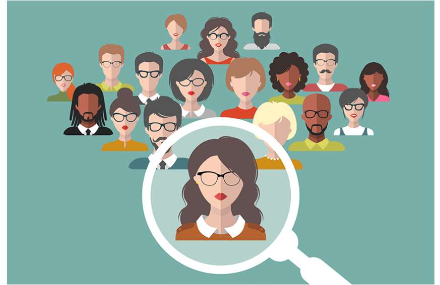
Atracción & Desarrollo Talento (Transformación)